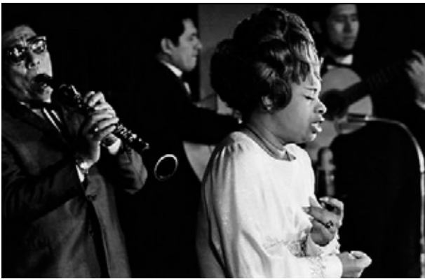
Concierto en Lima, 1972

representantes nacionales de la discográfica RCA Victor, quienes la llevan a grabar su primer LP.