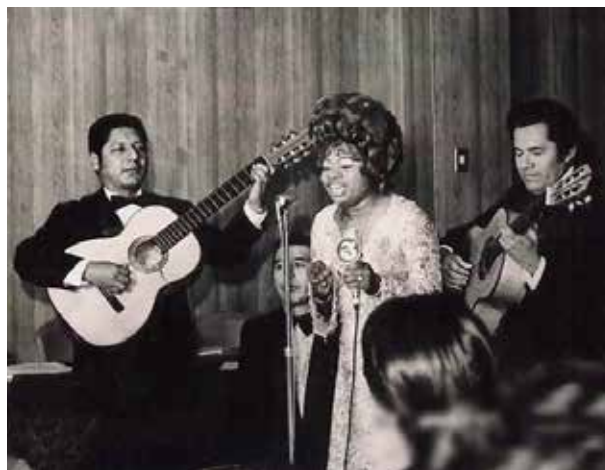
Lucha Reyes, 1970

su voz poderosa. En una de esas presentaciones es avistada por un cazatalentos, que la lleva a la Peña Ferrando , revista musical creada por el promotor Augusto Ferrando, quien la contrata para su elenco y le pone el sobrenombre de «La Morena de Oro del Perú». Durante