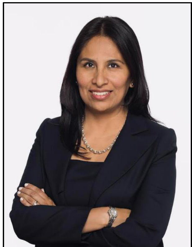
CEO y Fundadora de “Inclusive Mining” y PDAC Board Director & HispanoMine Co-Founder & Director

Hoy en día, estoy orgullosa de haber consolidado mi carrera y de haber fundado mi propia empresa, Inclusive Mining, una firma de reclutamiento que ayuda a las compañías mineras a encontrar líderes inclusivos que generen cambios positivos en la industria. Además, he podido combinar mi carrera con mi vida personal, creando una familia en Canadá sin olvidar nunca mis raíces peruanas. A lo largo de los años, también he trabajado en diferentes iniciativas para ayudar a mujeres e inmigrantes, y he sido parte de HispanoMine, una organización sin fines de lucro que empodera a los profesionales latinoamericanos en el sector minero. Cada uno de estos logros me recuerda la importancia de enfocarse en las fortalezas y convertir las barreras en oportunidades.”